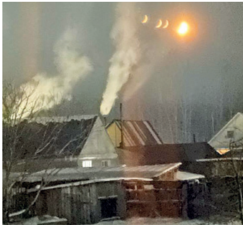
Зима — лучшее время для возвращения в детство. Когда идёт снег, мы снова чувствуем себя детьми. Виктория ГОЛОВАТЮК, 10 класс, Сузунская школа № 2