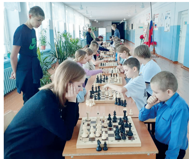
Шахматные баталии в разгаре