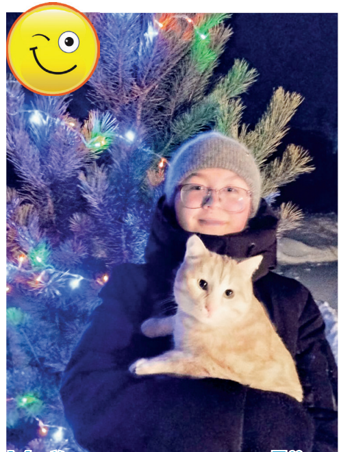
Мой кот по кличке Лёва

Первыми снимки для акции «Без кота — жизнь не та» прислали наши юнiores!