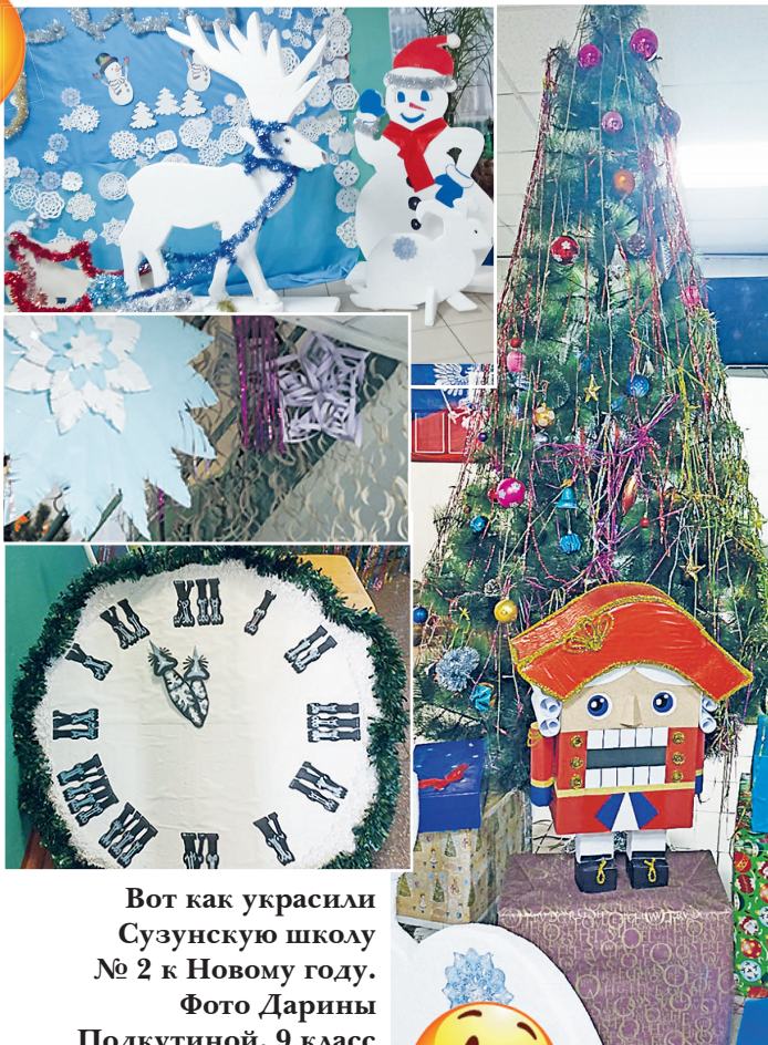
Вот как украсили Сузунскую школу № 2 к Новому году.

Алина БАННИКОВА, 7 класс, Битковская школа