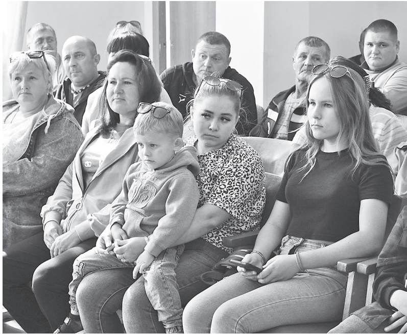
Жителей на встречу с Главой района собралось много