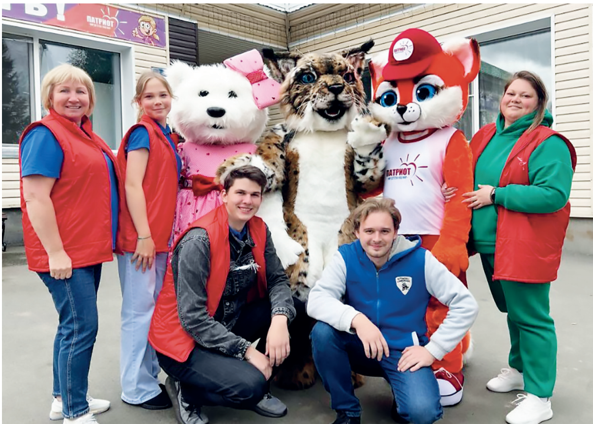
А это самые творческие и креативные сотрудники центра «Патриот»